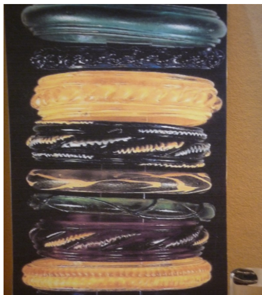
Glazen armbanden, Archeologisch museum Bibracte, Mont Beuvray ( Fr )